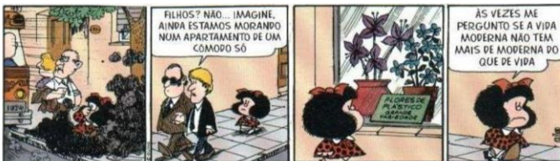
FIGURA 22: POLUIÇÃO URBANA

Quando refletimos sobre ambientes urbanos nas tiras, observamos a poluição, o congestionamento e por último, a adaptação do ser humano à urbanização. Na figura a seguir, outras consequências da urbanização serão apresentadas, na figura 22.