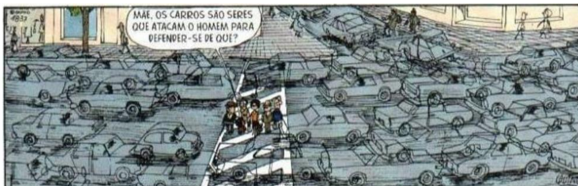
FIGURA 20: CARROS AGRESSIVOS