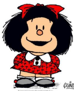
FIGURA 1: MAFALDA

Neste subcapítulo, serão apresentados os personagens das tiras da Mafalda, criados por Quino. Serão expostas as figuras/imagens para facilitar o reconhecimento dos personagens e as suas características principais, para conhecer melhor a personalidade de cada um deles e o que eles representam nas tiras. Primeiramente, vamos conhecer a personagem principal, a Mafalda na figura 1: