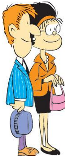
FIGURA 2: PAIS DA MAFALDA