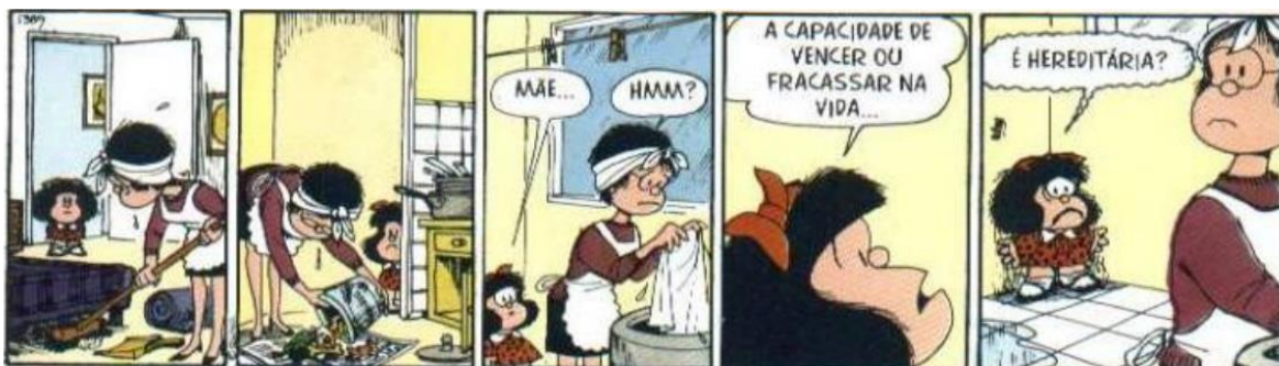
FIGURA 16: VENCER

Além da crítica que a Mafalda faz à mãe por não ter estudado, outras tiras da personagem expõem a temática da condição da mulher. Na figura a seguir, podemos perceber a preocupação da Mafalda com relação ao seu futuro como mulher.