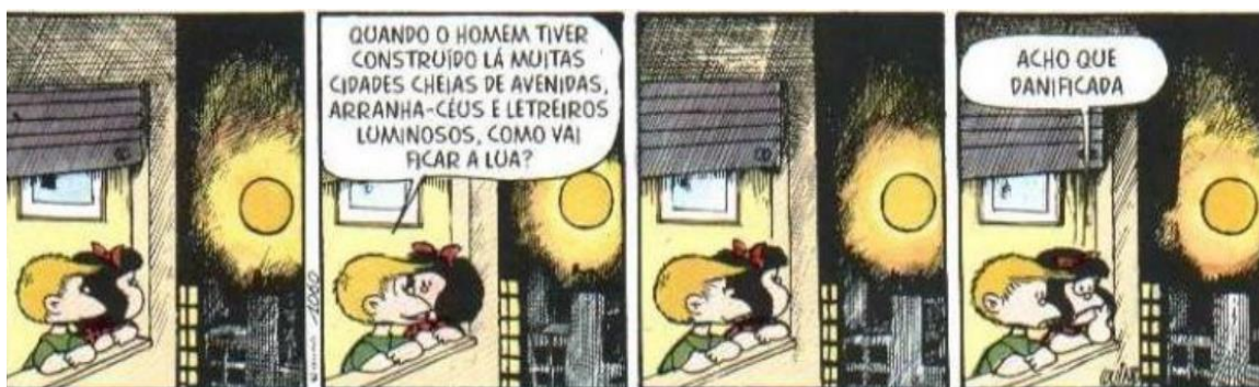
FIGURA 19: GUERRA ESPACIAL

A urbanização é uma temática bastante presente nas tiras, é interessante conversar com os/as estudantes e, discutir sobre como o ser humano interfere no planeta com a construção das cidades. Na tira a seguir, da figura 19, poderemos observar a forma como dois personagens enxergam as grandes cidades.