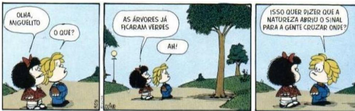
FIGURA 21: SINAIS DA NATUREZA