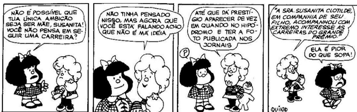
FIGURA 17: AMBIÇÃO

A mãe da Mafalda representa o típico pensamento das mulheres naquela época, onde o papel da mulher era visto ligado as tarefas domésticas e da maternidade. Outra personagem que possui o mesmo posicionamento, é a Susanita, e, ela e a Mafalda entram em conflito com esse assunto, pois possuem visões totalmente diferentes. Essa divergência de opiniões fica explícita na figura 17: