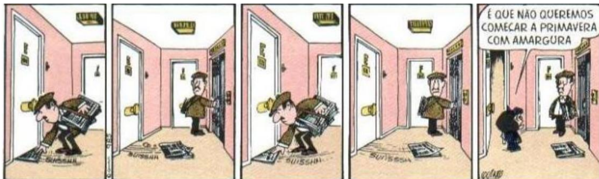
FIGURA 11: O JORNAL

de expressão, o contexto foi marcado por violência também. Os tempos eram difíceis e nas tiras da Mafalda o autor busca retratar este período de forma irônica, como na figura 11, que será apresentada a seguir.