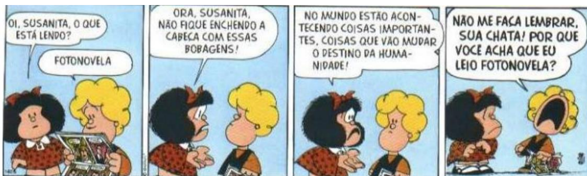
FIGURA 13: ILUSÕES

Diante dos acontecimentos nas décadas de 1960 e 1970, que foram mencionados anteriormente, uma característica da sociedade é bastante criticada por Quino em suas tiras: a alienação. O assunto é abordado de uma forma irônica e humorada, como será apresentado na figura 13.