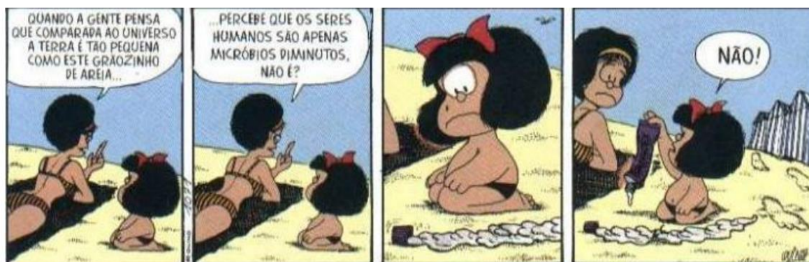
FIGURA 18: PEQUENOS SERES, GRANDES ESTRAGOS