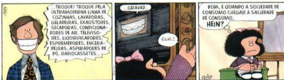
FIGURA 12: SACIÁVEL

Além de retratar o período de tensão marcado pelo regime militar, as tiras da Mafalda apresentam outras características do período, como por exemplo, o consumismo. O tema é abordado de uma forma reflexiva, como veremos mais adiante, na figura 12.