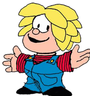
FIGURA 6: MIGUELITO