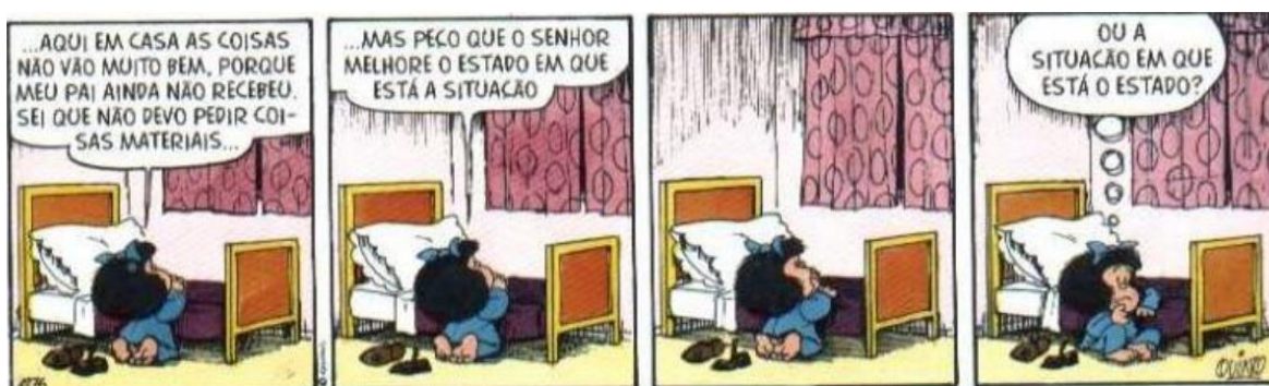
FIGURA 9: O ESTADO DA SITUAÇÃO

O Quino se preocupou em abordar assuntos pertinentes na sociedade naquela época, sem se preocupar com as críticas e com o contexto vivido neste período. Seu objetivo era, principalmente, trazer diferentes discussões e questionamentos para a sociedade, como veremos na figura a seguir.