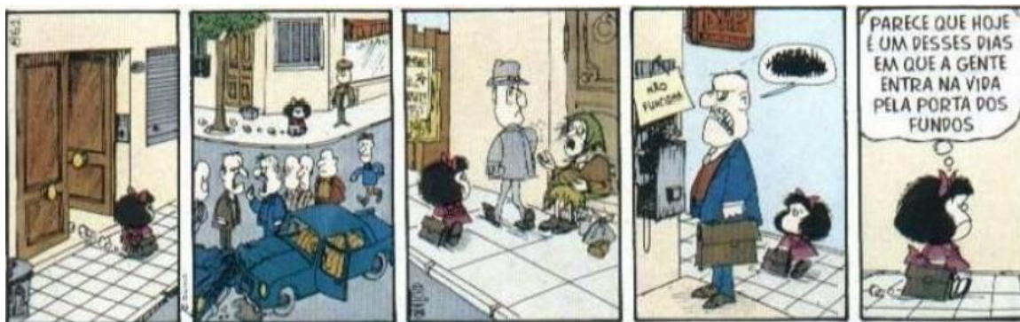
FIGURA 24: VIOLÊNCIA URBANA