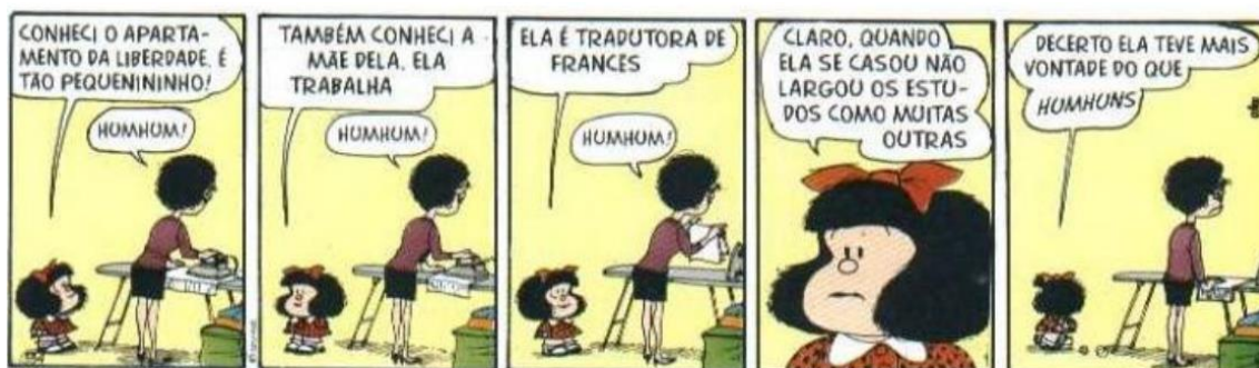
FIGURA 15: ESTUDOS

É nítida a posição da Mafalda em relação ao papel da mulher na sociedade. Nas tiras, Quino, trouxe duas personagens para entrarem em conflito com o pensamento da personagem principal: Susanita e a mãe da Mafalda, como veremos na figura 15.