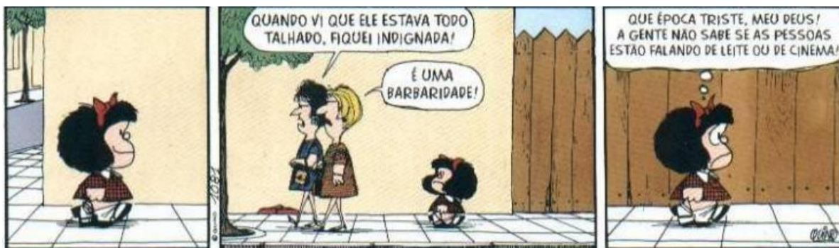
FIGURA 10: INDIGNADA COM A REALIDADE

O contexto vivenciado pela sociedade nessa época, é mencionado em outras tiras criadas por Quino, como será apresentado na próxima tira (figura 10).