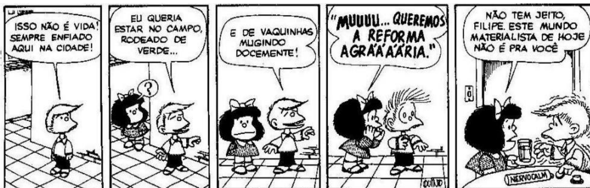
FIGURA 23: CIDADE MONÓTONA

O conceito de urbano abordado nesta pesquisa, faz referência também ao campo/rural. Além de reconhecer suas diferenças, é preciso saber sobre o meio rural e a estrutura agrária. A seguir, Quino, traz em sua tira a questão da reforma agrária, na figura 23.