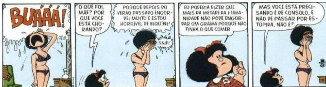
FIGURA 14: CORPO E FOME

Relacionado ao contexto de globalização, é possível trazer diferentes abordagens acerca do tema. Um outro assunto que pode ser discutido em sala de aula, é a fome. Quino ironiza a fala da Mafalda, em relação à mãe da personagem, como veremos a seguir na figura 14.