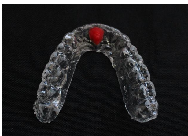
Fig. 5. Stop de oclusão confeccionado sobre a base da placa.

extensão da base da placa para obtenção de contatos oclusais bilaterais simultâneos - os dentes tocam a superfície plana da placa com intensidade leve e uniforme de maneira que os contatos anteriores fiquem ligeiramente mais suaves que os contatos posteriores (Fig. 6). O dispositivo interoclusal foi ajustado para apresentar guia anterior e guia de caninos de maneira que os caninos inferiores tocassem a base de resina acrílica no final da protrusão e da guia de caninos. Foi utilizada película de carbono de 21 micrômetros para obtenção da intensidade correta dos contatos. Ajustes foram realizados com broca maxicut e para o polimento, utilizou-se borrachas e escovas específicas para resina acrílica.