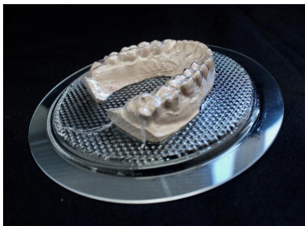
Fig. 2. Placa de acetato de 1mm plastificada no modelo de gesso.