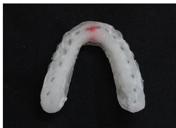
Fig. 6. Placa oclusal após contatos bilaterais simultâneos.

As PEM ao final da terceira consulta e antes da entrega possuíam as seguintes características finais: rigidez, estabilidade e retenção, lisura e sem marcas edentadas, lateralidade em caninos quando possível, espaço de 2 a 2,5 mm entre os últimos dentes e acompanhamento da linhas equatorial dos dentes (Fig. 7). Os pacientes foram orientados sobre a utilização diária das placas durante o sono e sobre a correta conservação e higiene das mesmas.