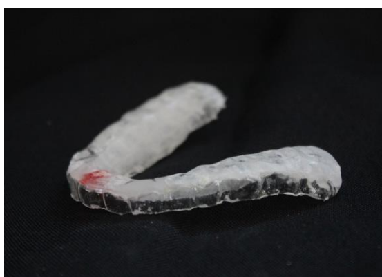
Fig. 7. Placa com características finais pronta para uso.

As PEM ao final da terceira consulta e antes da entrega possuíam as seguintes características finais: rigidez, estabilidade e retenção, lisura e sem marcas edentadas, lateralidade em caninos quando possível, espaço de 2 a 2,5 mm entre os últimos dentes e acompanhamento da linhas equatorial dos dentes (Fig. 7). Os pacientes foram orientados sobre a utilização diária das placas durante o sono e sobre a correta conservação e higiene das mesmas.