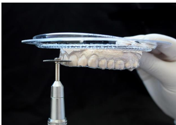
Fig. 3. Limite da altura vestibular da base da placa de 2mm.