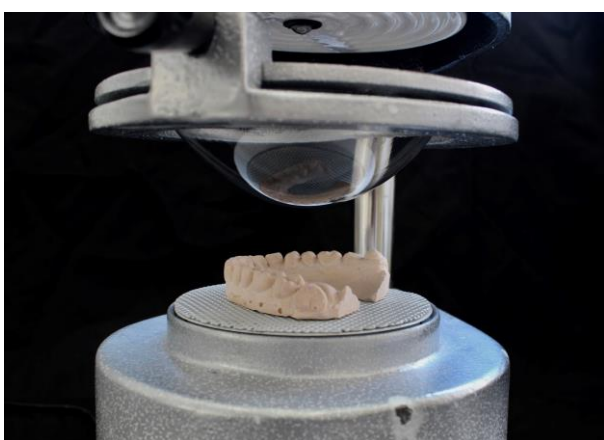
Fig. 1. Modelo superior na plastificadora à vácuo.

Na segunda visita, foi realizada moldagem da arcada superior com alginato de presa regular e confecção do respectivo modelo de gesso com gesso tipo IV. Em laboratório, com auxílio de uma plastificadora à vácuo (Fig. 1), foi confeccionada a base do dispositivo interoclusal com acetato de 1mm (Fig. 2). Realizou-se recortes na base da placa, garantindo a altura de 2mm na sua face vestibular e 10mm da borda gengival ao centro do palato (Fig. 3 e 4).