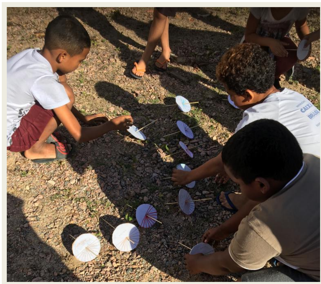
Imagem 10: Saída de campo para teste do funcionamento dos relógios de sol.

Todos os relógios apontaram a hora com uma leve variação de um para o outro. Onde de modo geral, as crianças interagiram muito bem à complexidade da atividade proposta, participando e entendendo como funciona a determinação das horas. Finalizamos a aula e nossos encontros com um registro especial, conforme apresentado na figura 11.