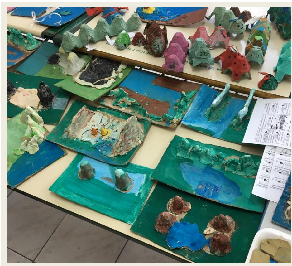
Imagem 02 – Exposição de maquetes sobre relevo em feira de ciências