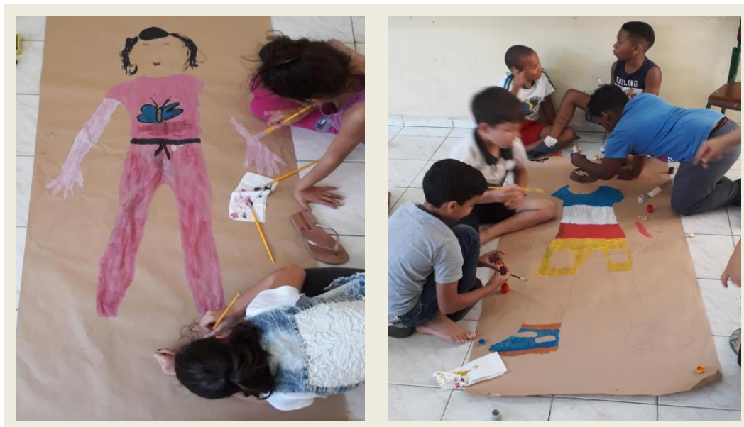
Imagem 03 – Produção de mapa do corpo