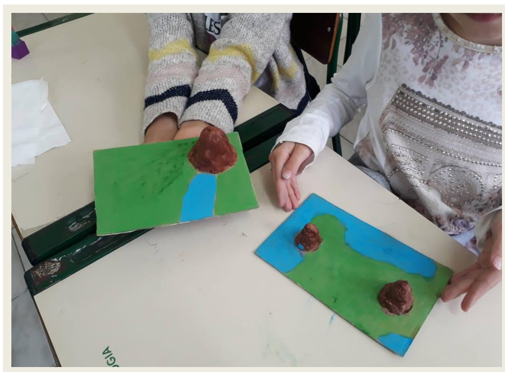
Imagem 01 – Maquetes de duas estudantes do 3ª ano.

O interessante foi a participação das crianças nesse momento da aula onde um dos meninos relatou que morava em uma colina. Após explicação teórica, foi iniciada a construção das maquetes deixando livre para escolha a forma de relevo que os/ás estudantes queriam representar – Planalto, Montanha, Colina, Planície, Depressões ou Vale (figura 01).