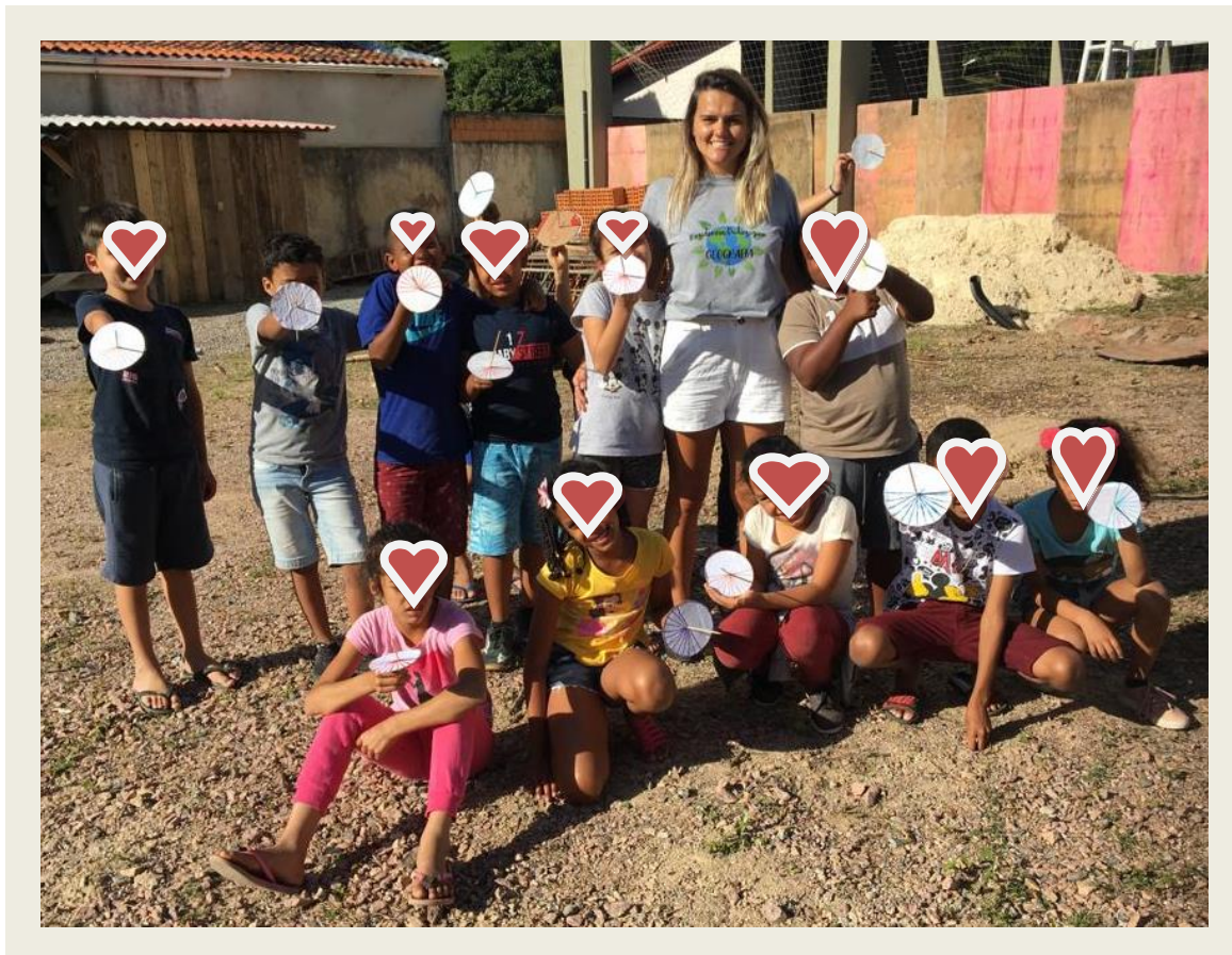
Imagem 11: Registro de finalização da atividade.