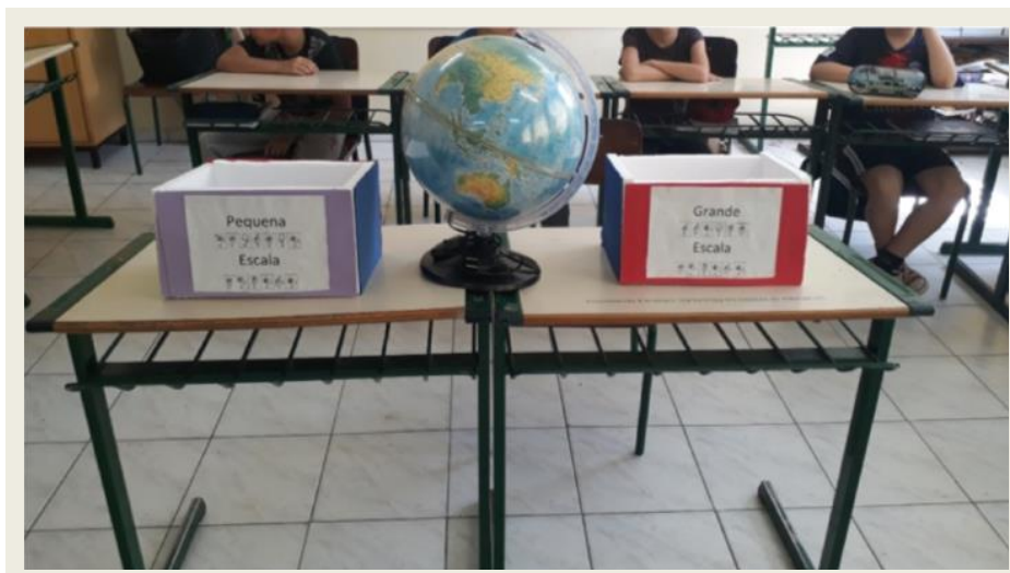
Imagem 05. Caixa: Escala Maior e Menor