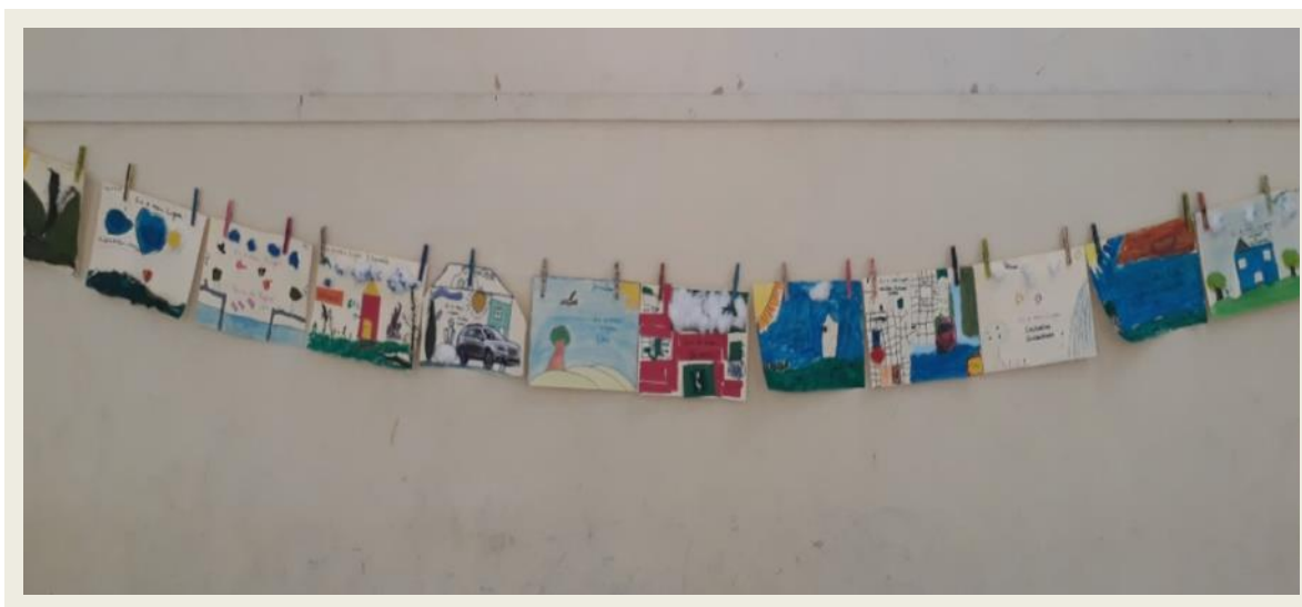
Imagem 07. Varal Geográfico confeccionado pelos/as estudantes do 3º ano

A partir dos relatos e da organização dos trabalhos, foi possível observar que os elementos que eles associaram como pertencentes ao seu lugar foram objetos relacionados às suas casas, pessoas, lugares que frequentam que tem relação com as suas vidas e fazem parte do seu lugar de vivência. É relevante ressaltar que todos os murais confeccionados tinham um valor subjetivo e representavam a leitura do seu lugar no mundo, trazendo para seu pequeno mural componentes característicos de suas vidas em Florianópolis, conforme se observa na imagem 07.