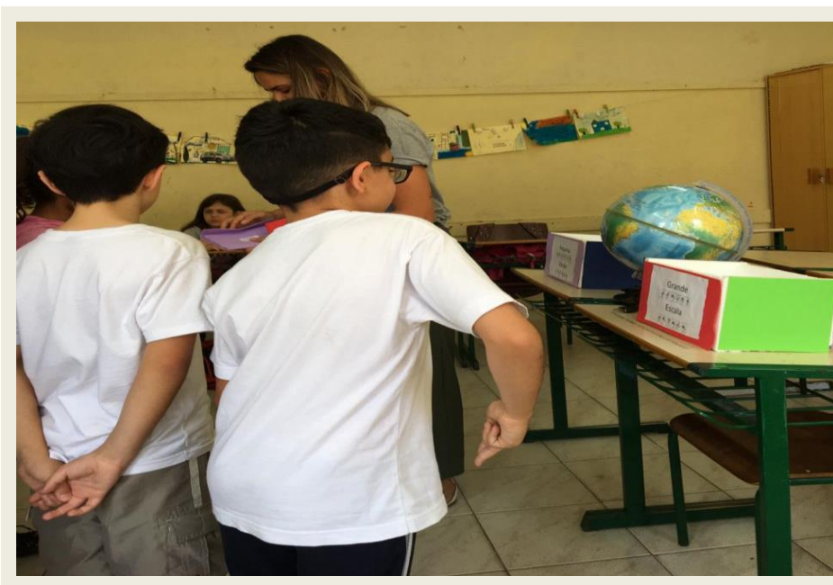
Imagem 06. Gincana sobre escalas.